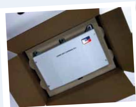
De FormCut 3D toegepast!

Graag informeren wij ook u over de mogelijkheden, neem daarvoor contact op met onze verkoopafdeling.